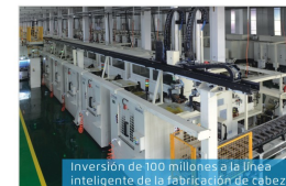
Inversión de 100 millones a la línea inteligente de la fabricación de cabezal