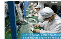
Centro de fabricación profesional del motor de ahorro de energía