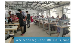
La selección segura de 500,000 usuarios